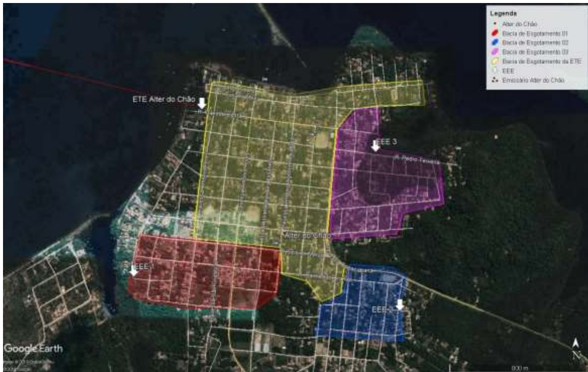
Figura 01 – Divisão do distrito urbano de Alter do Chão em bacias de esgotamento.